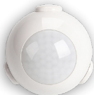
MTSWFW1 Motion Sensor Détecteur de mouvement