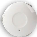
FLDWFW1 Water Leak Sensor Détecteur de fuite d'eau