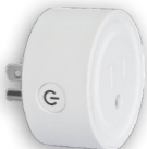
PLGWFW1 Smart Plug Prise intelligente