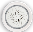
ALARMWFW1 Siren Alarm Sirène d'alarme